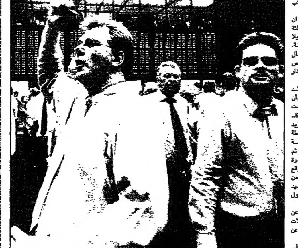
متمثلون في بورصة فرانكفورت اسس